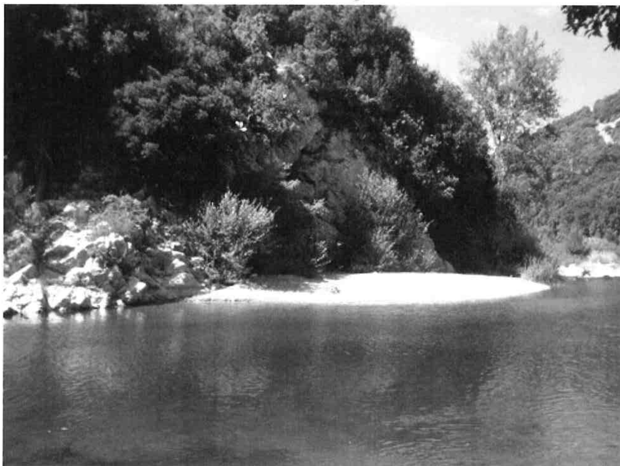
Fiume Calore – Benevento.

(d.lgs. 118/2011 corretto ed integrato dal d.lgs. 126/2014)